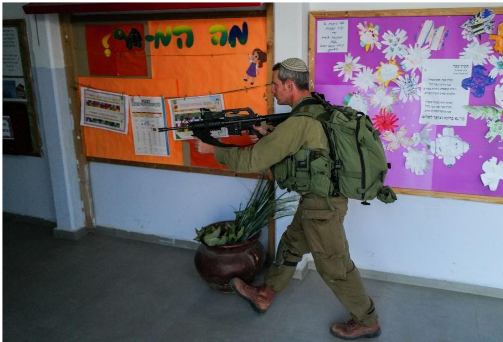
Figura 1: Soldado Israelense em treinamento dentro de escola

THE TIMES OF ISRAEL. Reservist soldiers train in school classrooms amid war . 19 out. 2023. Disponível em: https://www.timesofisrael.com/reservist-soldiers-train-in-school-classrooms-amid-war/ . Acesso em: 29 set. 2025.