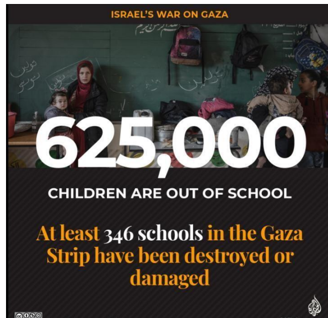
Figura 6: Crianças fora da escola e vítimas da guerra

AL JAZEERA. Education under attack: 625,000 children out of school in Gaza . 2024. Disponível em: https://www.aljazeera.com/ . Acesso em: 29 set. 2025.