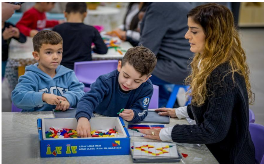
Figura 4: Crianças retomando atividades escolares em Sderot