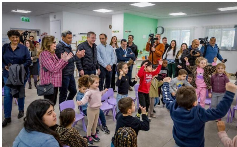
Figura 3: Crianças e famílias celebrando a reabertura escolar

THE TIMES OF ISRAEL. Back to school: families and children celebrate reopening of schools in Sderot . 2023. Disponível em: https://www.timesofisrael.com/ . Acesso em: 29 set. 2025.