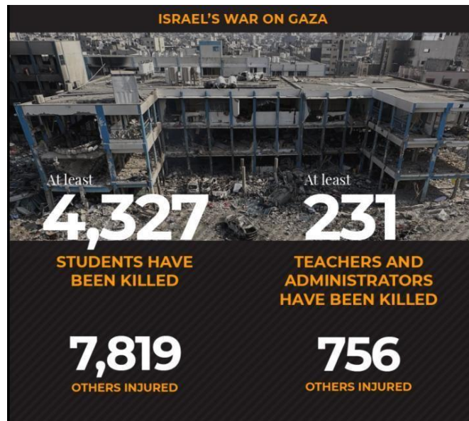
Figura 5: Escola destruída na Faixa de Gaza

AL JAZEERA. Gaza schools were destroyed and damaged during war. 2024. Disponível em: https://www.aljazeera.com/ . Acesso em: 29 set. 2025.