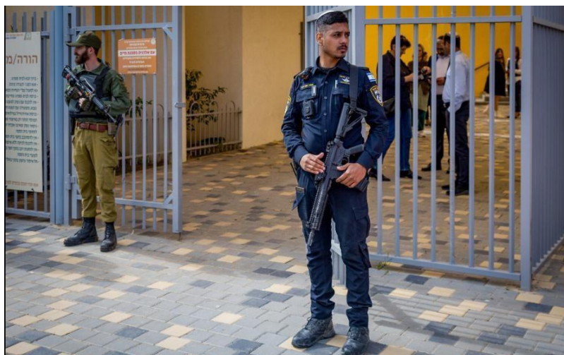
Figura 2: Soldado e policial armados em frente à escola em Sderot

THE TIMES OF ISRAEL. Armed soldiers and police secure schools in Sderot amid tensions . 2023. Disponível em: https://www.timesofisrael.com/ . Acesso em: 29 set. 2025.